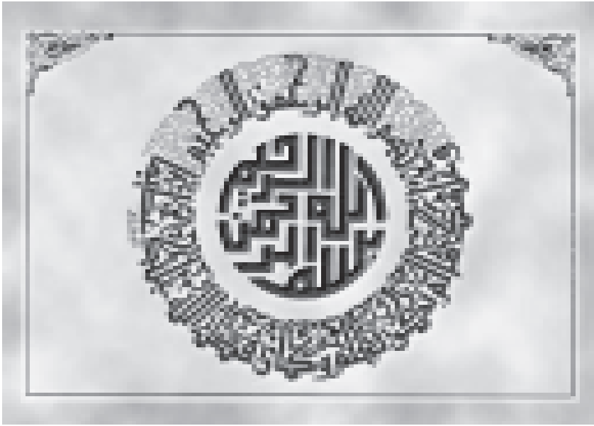
പ്രബോധനം ഖുർആൻ വിശേഷാൽപതിപ്പ് 2002

ആദ്യമോ അവസാനമോ ഇല്ലാത്ത ഒരു ഗ്രന്ഥമാണ് ഖുർആൻ. എവിടെനിന്നും വായന ആരംഭിച്ച് എവിടെയും അവസാനിപ്പിക്കാം. അതനന്തമാണ്. അല്ലെങ്കിൽ അനന്തതയിലേക്കുള്ള ഒരു വാതായനം.